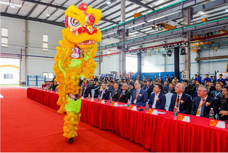
开业典礼上的传统舞狮表演