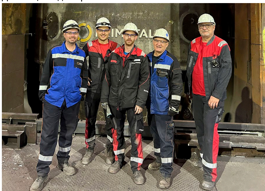
Частичный состав команд Primetals Technologies и voestalpine на объекте в Донавице сразу после первой плавки в LD-конвертере (КК) №4.

Данный пресс-релиз и бесплатная фотография к нему доступны по ссылке: